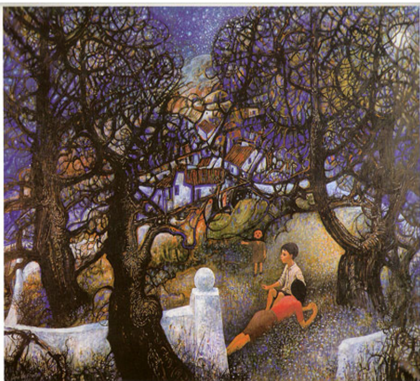
Crianças no horto