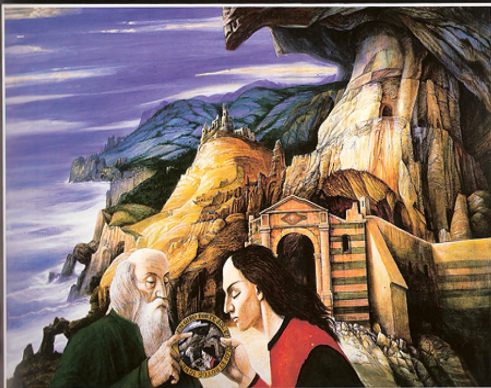
Dante e Virgílio à entrada do purgatório